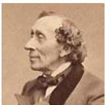
Hans Christian Andersen (1805)

Uważa się, że da Vinci cierpiał na liczne zaburzenia w przyswajaniu wiedzy, w tym na dysleksję i deficyt uwagi. Niektórzy sądzą, że świadczy o tym choćby fakt rozpoczęcia znacznie większej liczby projektów, niż mógł kiedykolwiek ukończyć. Liczne dowody z rękopisów i listów Leonarda potwierdzają diagnozę dysleksji. Podobno pisał w odwrotnym kierunku, z prawej do lewej, w odbiciu lustrzanym. Jest to wspólna cecha wielu leworęcznych dyslektyków. Poza charakterem pisma błędy ortograficzne w rękopisach i dziennikach demonstrują trudności językowe znane cierpiącym na dysleksję. Da Vinci przezwyciężył braki w przyswajaniu wiedzy, kierując swoje talenty twórcze na wizualne przedstawienie własnych myśli. Nikt jeszcze nie dorównał jego twórczej, analitycznej i wizjonerskiej inwencji.