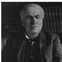
Tomasz Edison (1847)

Genialny wynalazca, samouk, twórca między innymi: żarówki, fonografu, kineskopu. Nigdy nie przyswoił sobie zasad ortografii, miał też problemy z arytmetyką. W szkole nie mógł sobie poradzić, o czym pisał w pamiętniku. Wspomina: „a ja niemal uwierzyłem, że jestem matosem...”.