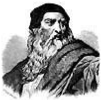
Leonardo da Vinci (1452)

Dysleksja to „przypadłość” z jaką musieli się mierzyć najwięksi i najmądrzejsi, którzy wnieśli ogromny wkład w rozwój nauki, sztuki, medycyny. Są wśród nich słynni artyści estrady, projektanci, architekci, pisarze, sportowcy, prawnicy, lekarze, uczeni, politycy i ludzie biznesu, a oni sami są najlepszym dowodem na to, że sukces jest w zasięgu możliwości, a można go osiągnąć cierpliwością i systematyczną pracą, dzięki wspieraniu talentów, pasji i zainteresowań.