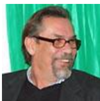
Jacek Żakowski (1957)

Whoopi Goldberg, prawdziwe nazwisko Carolyn Johnson, doskonała amerykańska artystka estradowa, grała również w tak znanych filmach, jak Ghost, Sister Act I and II, Made in America, Jumping Jack Flash, The Color Purple i Star Trek: Generations. Whoopi miała mnóstwo trudności w szkole, ale dopiero w dorosłym życiu dowiedziała się, że cierpi na dysleksję. Pamięta, że kiedy dorastała, nazywano ją tępą i głupią, bo miała problemy z czytaniem. Dla nauczycieli i rodziców nie ulegało wątpliwości, że nie jest ani powolna, ani tępa, ale ma jakieś kłopoty, które nie zostały jeszcze dokładnie zdefiniowane. Pomimo dysleksji Whoopi Goldberg może się pochwalić bardzo udaną karierą filmową i telewizyjną.