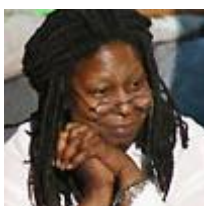
Whoopi Goldberg (1955)

Uważany za największego naukowca wszech czasów, autor teorii względności. Bardzo późno zaczął mówić, czytać nauczył się dopiero w wieku 9 lat. Miał też problemy z pisaniem. Ze względu na słabą pamięć z trudem przyswajał wiedzę z różnych dziedzin. Duże braki wiedzy przyczyniły się do tego, że oblał swój pierwszy egzamin na studia. Dwukrotnie stracił pracę nauczyciela z powodu trudności związanych z dysleksją.