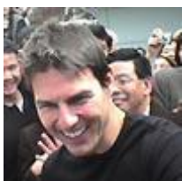
Tom Cruise (1962)

Znawca kuchni, autor wielu książek o tematyce kulinarnej. Nauka czytania sprawiała mu dużo problemów, a poziom graficzny pisma poprawił dopiero, gdy zaczął pisać drukowanymi literami. Maciej Kuroń, podobnie jak jego ojciec Jacek, miał ogromne trudności w uczeniu się języków obcych.