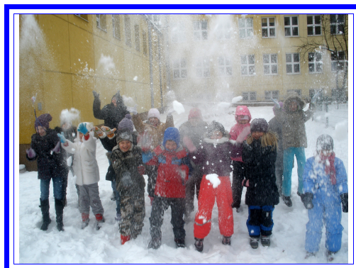
Pada, pada śnieg , a uczniowie kl. „III a” cieszą się z nadejścia ferii zimowych.

Uczniowie wzięli udział w spotkaniu, którego głównym celem było uświadomienie konieczności zachowania bezpieczeństwa podczas zabaw zimowych oraz w czasie uprawiania sportów zimowych.