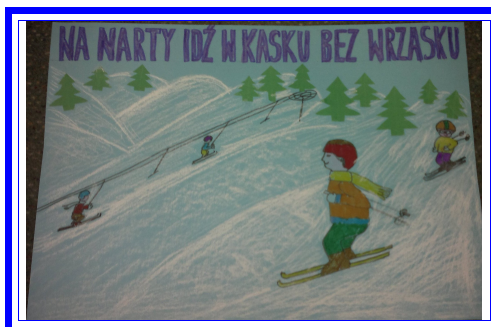
Prace uczniów klasy III a ( r.sz.k.2011/2012)